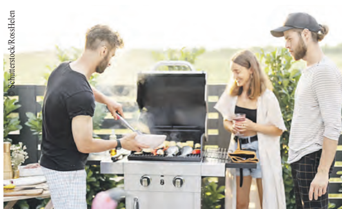
Nachhaltig ist es, einen Elektrogrill zu nutzen.

Weitere Informationen zum ersten Thema sind zu finden unter https://hamburg.de/go/76676 . Weitere Informationen zur Gewässerpflege gibt es unter https://hamburg.de/go/76668 .