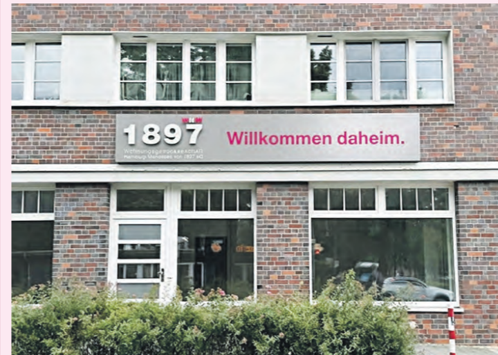
Der zukünftige Nachbarschaftstreff befindet sich in der Holzmühlenstraße 95 (Foto mit KI erstellt).

Neben dem Instandhalten und Bewirtschaften von hochwertigem Wohnraum zu bezahlbaren Preisen hat das Thema „Soziale Verantwortung“ zentrale Bedeutung in dem genossenschaftlichen Handeln der WHW von 1897 eG. Deshalb wurde nach breiter Zustimmung aus den Reihen der Vertreter 2025 die neue Stelle „Soziales Management“ geschaffen, um Mitglieder bei Sorgen und Belastungen beraten und unterstützen zu können.