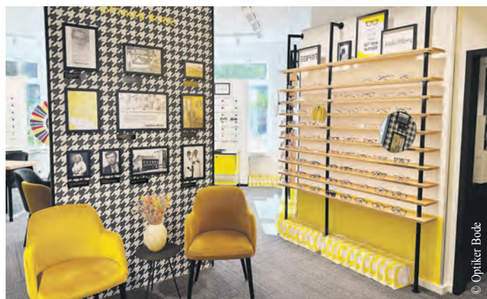
Die Kundinnen und Kunden erwartet ab sofort ein völlig neues Einkaufserlebnis mit modernem Ambiente.

Weitere Informationen gibt es auf www.optiker-bode.de .