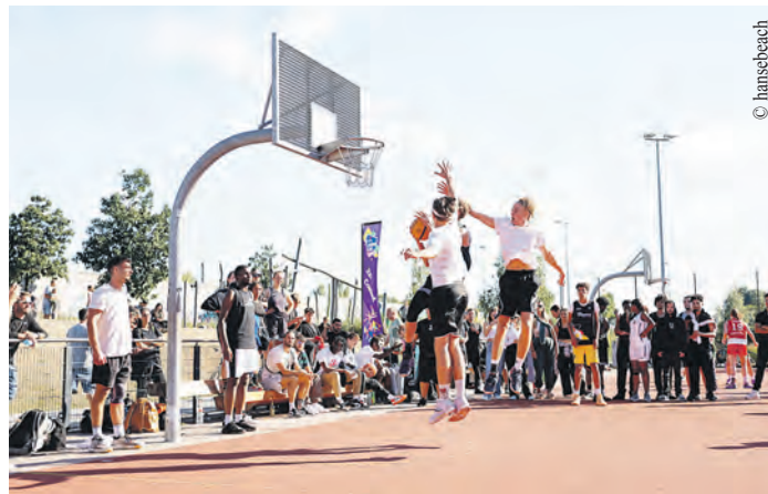
Zahlreiche Vereine präsentieren auch in diesem Jahr wieder die gesamte Vielfalt der Sportlandschaft für alle Altersklassen.

Beim Active City Summer öffnen Hamburger Vereine über drei Monate lang ihre Kurse und Trainingsstunden für Interessierte, die so neue Sportarten