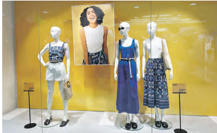
Die Fashion-Stores haben sich auf die Freiluft-Saison eingestellt und bieten trendige Outfits für jeden Geschmack.

Auch wer in diesem Jahr keine Koffer packt und zu Hause bleibt, braucht auf Ferienspaß keinesfalls zu verzichten. Bietet Hamburg doch so viele Möglichkeiten, dass ein Sommer gar nicht genügt, um alles auszuprobieren. Ein Bummel durch den Einkaufstreffpunkt Farmsen gehört unbedingt dazu. Hier kann man sich mit Freunden