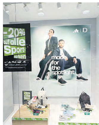
Unter dem Motto „made for the spotlight“ gibt es bei Deichmann aktuell 20% Rabatt auf alle Sportmarken.

Dekorationen liefern. Verschiedene Dienstleistungsbetriebe bieten einen umfassenden Service an und in den ansässigen Supermärkten kann man sich gleich für den nächsten Kochabend ausstatten. Abgerundet wird der attraktive Branchenmix durch verschiedene Gastronomiebetriebe.