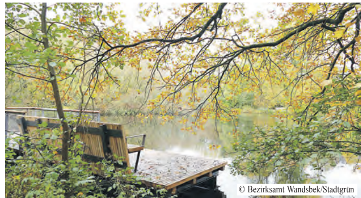
Einzelne Elemente, wie der neu entstandene Eichtalsteg, sind bereits in Betrieb.

„Es ist ein gutes und wichtiges Signal, dass die Eröffnung des Klimaparks nun konkret für den 20. Juni geplant ist. Nach den