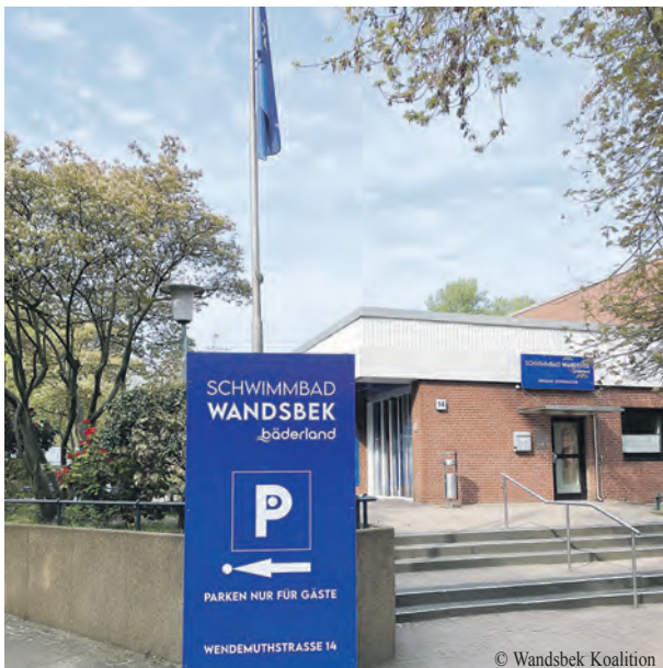
Das Schwimmbad Wandsbek steht den Besucherinnen und Besuchern ab sofort an zwei Tagen in der Woche uneingeschränkt zur Verfügung.

Nachdem der öffentliche Betrieb des Schwimmbades Wendemuthstraße Anfang des Jahres zwischenzeitlich weitgehend eingestellt wurde, steht das Bad allen Besucherinnen und Besuchern nun wieder an zwei Tagen in der Woche uneingeschränkt zur Verfügung.