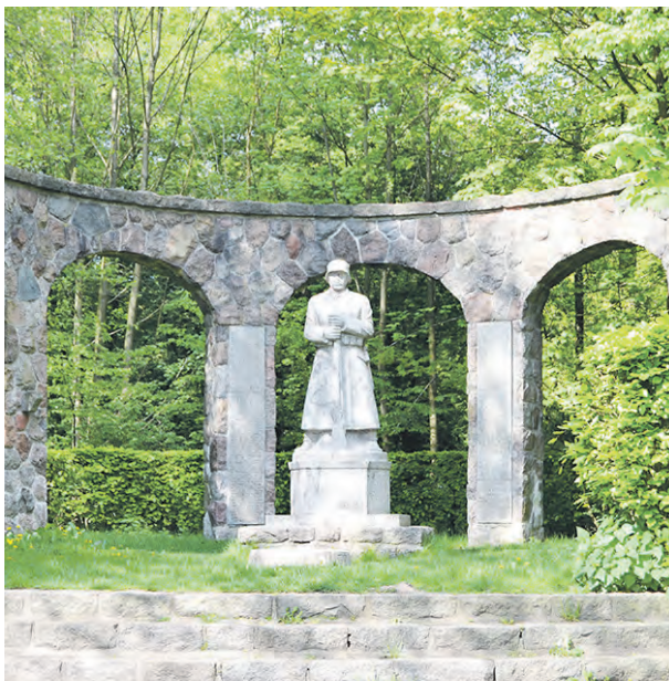
Schon seit Jahren soll das Kriegerdenkmal am Alten Teich umgestaltet werden, doch immer wieder kam es zu Verzögerungen. Nun ist es endlich soweit.

Ein finsterblickender Hüne mit Stahlhelm umklammert sein Gewehr, eingerahmt von Bögen aus Natursteinen: Ein Ort, um sich kritisch mit dem Krieg auseinanderzusetzen, ist das Denkmal am Alten Teich in Bramfeld sicher nicht. Schon länger wurde gefordert, das Monument umzugestalten – jetzt ist es endlich soweit. Mit einer Pressemitteilung hat das Bezirksamt Wandsbek angekündigt, dass die Bauarbeiten zur Kommentierung des Kriegerdenkmals Mitte