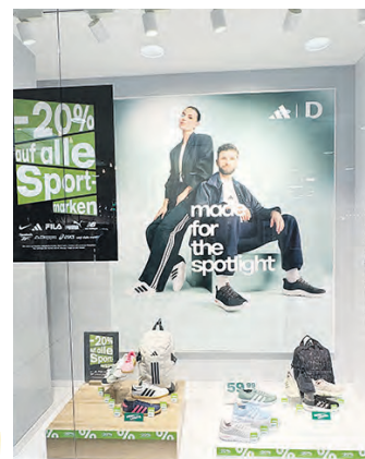
Unter dem Motto „made for the spotlight“ gibt es bei Deichmann aktuell 20% Rabatt auf alle Sportmarken.

Dekorationen liefern. Verschiedene Dienstleistungsbetriebe bieten einen umfassenden Service an und in den ansässigen Supermärkten kann man sich gleich für den nächsten Kochabend ausstatten. Abgerundet wird der attraktive Branchenmix durch verschiedene Gastronomiebetriebe.