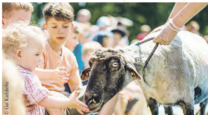
Das Schafschurfest zieht jedes Jahr viele Familien an.

Alle Veranstaltungen finden in der Bramfelder Chaussee 265 statt. Tickets gibt es online unter www.brakula.de oder direkt vor Ort. Das Büro ist Mo., Di. und Do. von 16 bis 19 Uhr sowie Mi. von 10 bis 13 Uhr geöffnet.