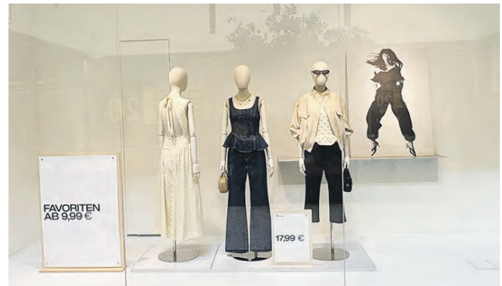
Inspirationen in Sachen Mode und Textil liefern die Bekleidungsfachgeschäfte des Centers.

Alles, was man für bevorstehende Anlässe, aber auch für den täglichen Bedarf benötigt, findet man im Einkaufstreffpunkt Farmsen. Hier gibt es auf rund 23.000 Quadratmetern insgesamt 70 Fachgeschäfte, die zum Stöbern und Entdecken einladen und sowohl Inspiration in Sachen Mode und Textilien, Schuhe und Accessoires als auch neue Ideen für schöne