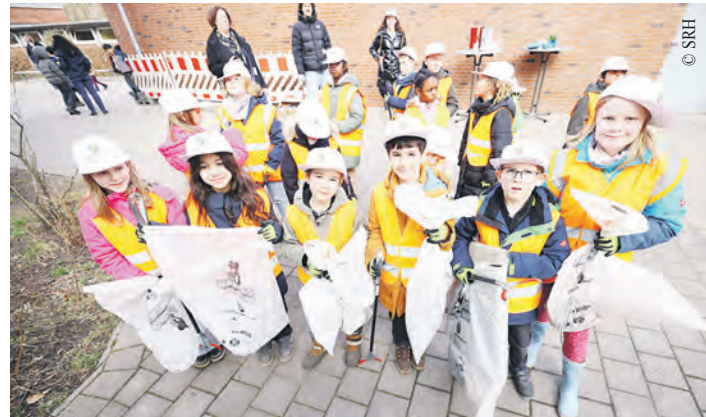
Putzmuntere Hamburgerinnen und Hamburger säubern in diesem Jahr vom 20. Februar bis zum 1. März ihre Stadt.

Außerdem werden unter allen Aufräumteams erneut Sach- und Erlebnispreise zahlreicher Unternehmen aus Hamburg und Umgebung verlost. Darunter beispielsweise ein Kaffeeseminar, Freikarten für das Hamburg Dungeon, das Miniatur Wunder-