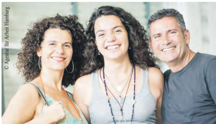
Eltern sind für Jugendliche wichtige Ansprechpartner bei der Berufswahl.

Mit der Onlineveranstaltung „Update Eltern“, die am 5. Februar von 18 bis 19.30 Uhr stattfindet, bietet die Agentur für Arbeit Hamburg in Kooperation mit der Behörde für Schule und Berufsbildung Hamburg aktuelle Informationen zum Thema Berufswahl. Gemeinsam mit Expertinnen und Experten aus Hochschulen, Studierendenwerk, Wirtschaft und Freiwilligendiensten im In- und Ausland sowie der Berufsberatung informieren über • Berufswahl und die Möglichkeiten, Ihr Kind zu unterstützen • Wege nach dem Abitur sowie die Entscheidung zwischen Ausbil-