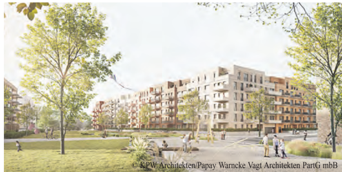
Visualisierung der Gebäude am Moosrosenweg.

das eigene Engagement dafür nachzudenken. Die Betrachter werden dazu aufgefordert, Verantwortung zu übernehmen, sich aktiv für die Bewahrung von Freiheit, Gerechtigkeit und Recht einzusetzen und diese Werte als Grundlage für gesellschaftlichen Zusammenhalt und friedliches Miteinander zu begreifen. Die Ausstellung, deren Exponate in den letzten Monaten in verschiedenen Konstellationen bereits in anderen Hamburger Bezirksämtern zu sehen war, wird noch bis zum 27. Februar im Bezirksamt Wandsbek, Schloßstraße 60, auf der Ausstellungsfläche im 2. Obergeschoss gezeigt. Sie kann montags bis freitags von 7 bis 19 Uhr besichtigt werden, der Eintritt ist frei.