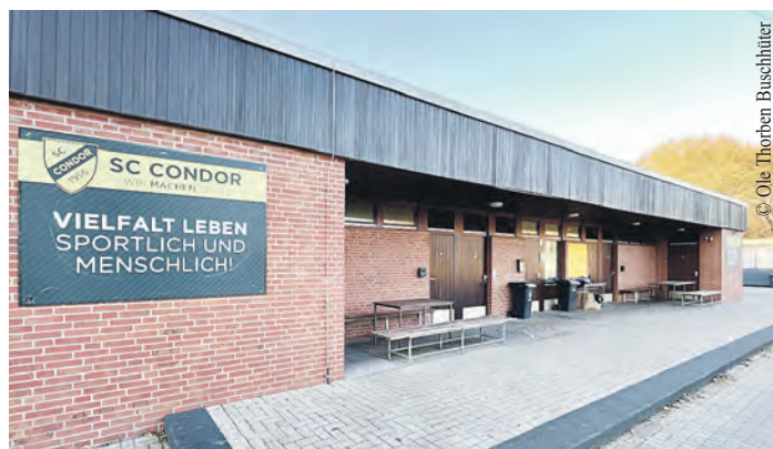
Die Umkleiden des SC Condor sollen saniert und erweitert werden.

Wenn ihr mehr über die Tischtennissparte des SC Condor erfahren möchte, besucht die Homepage unter https://scondor.de/tischtennis/ oder kommt einfach mal beim Spieltreff vorbei, der jeden Mittwoch um 17 Uhr in der Karl-Schneider-Halle, Berner Heerweg 183a, stattfindet.