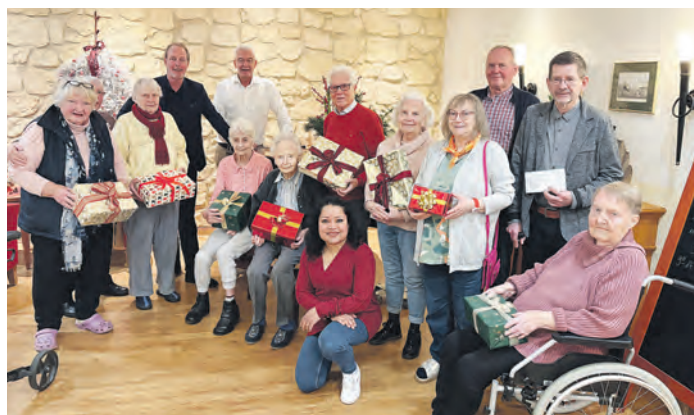
Die Initiatoren und Helfer konnten den Bewohnerinnen und Bewohnern rund 150 Päckchen übergeben.

Seit vielen Jahren gehört es im Stadtteil zur guten Tradition, die Bewohnerinnen und Bewohner von PFLEGEN & WOHNEN FARMSSEN, die keine Angehörigen mehr haben und auch anderweitig keine Unterstützung erhalten, zu Weihnachten mit einem kleinen Geschenk zu überraschen. Für viele von ihnen ist das leider oft die einzige Aufmerksamkeit, die sie zum Fest erfahren – und entsprechend groß ist die Freude.