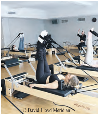
Beim Reformer Pilates werden insbesondere tiefliegende Muskelgruppen aktiviert.