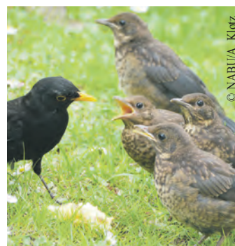
Der Nachwuchs vieler Gartenvögel wird gerade flügge.

Hecken schneidet, darauf achten, Vögel nicht unnötig zu stören. „Privatgärten und öffentliche Grünflächen sind wichtige Lebensräume im urbanen Raum, insbesondere, wenn sie naturnah gestaltet sind mit heimischen Hecken und Sträuchern. Diese Flächen tragen zur Artenvielfalt und zu einem angenehmen Stadtklima bei. Schon deshalb sollte der Erhalt solcher Grünflächen beim Klimaschutz mehr Gewicht erhalten“, ergänzt Malte Siegert, Vorsitzender des NABU Hamburg.