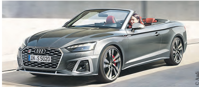
Zu sehen ist neben dem Audi A5 Cabriolet...

Der Sommer ist da und mit ihm auch Tage von schweißtreibender Sommerglut. Für diejenigen, die dann zumindest zeitweilig der Hitze entkommen wollen, gibt es zur Abkühlung folgende Empfehlung: Verdeck runter, Windschott hoch und Gas geben. Pessimisten sind Leute, die mit der Sonnenbrille in die Zukunft schauen, fand Heinz Erhard. Stimmt nicht. Sonst wären auch die Menschen Pessimisten, die sich ein Cabrio kaufen und in Städten wie Hamburg wohnen, wo es oft nur eine Handvoll warmer Oben-offen-Tage gibt. Die Hansestadt ist Deutschlands Cabrio-Hochburg – laut der CHECK24 Vergleichsportale für Kfz-Versicherungen GmbH sind 4,8 Prozent aller hier versicherten Pkw Modelle mit offenem Verdeck*. „Neben den sonnenver-