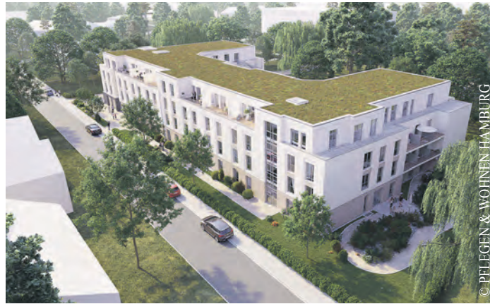
Mit der Initiative Zukunftspflege schafft PFLEGEN & WOHNEN HAMBURG durch Neubau und Modernisierungen Pflegeplätze nach den neuesten Standards und moderne Quartierskonzepte.

Vor diesem Hintergrund hat sich das Unternehmen entschlossen, die Einrichtung vollständig neu zu errichten. An der Stelle des rückgebauten Hauses am Park parallel zur Zitzewitzstraße entsteht nun ein moderner Neubau, der hell, freundlich, kommunikationsfördernd sowie gemütlich ausgestat-