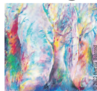
Dieses Werk trägt den Titel „Die Begeisterung“.

Präsentiert werden Werke, die vornehmlich mit Acryl auf Leinwänden erstellt worden sind. Das Hauptthema der Gemälde ist die Naturverbundenheit des Menschen und der damit beeinflusste Wandel der Natur. Dies drückt Bettina Behrend in expressiven Landschaftsbildern aus, wobei sich eine Bildsituation aus der anderen ergibt. Zusätzlich wird die Ausstellung mit Bildern des Regenwaldes in Liberia in Zusammenarbeit mit dem Verein „rettet den Regenwald e.V.“ ergänzt. Das gemeinsame Projekt fördert indigene Frauen. Die Künstlerin