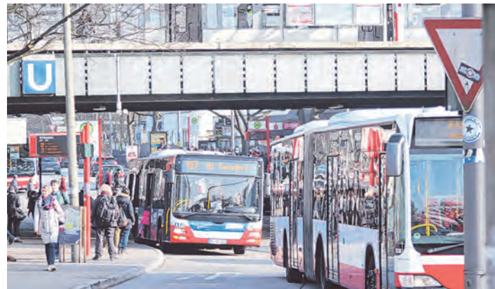
Ein Haltepunkt ist der U-Bahnhof Farmsen, wo der Blick auf das neue Verkehrskonzept gerichtet werden soll.

Im Anschluss machen sich die Teilnehmenden entlang der Berner Au auf den Weg zur ehemaligen Schule Berne in der Lienaustraße, die 2016 als Schulstandort aufgegeben wurde. Das von Fritz Schumacher entworfene Gebäude wird aktuell