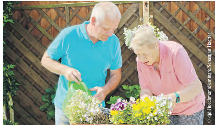
Die Wünsche und Anforderungen der Senioren sind sehr individuell. Professionelle Senioren-Assistenten gehen feinfühlig darauf ein.

Die Initiative „Redezeit für Dich“ aus Winterhude kümmert sich um Menschen mit Problemen wie Einsamkeit oder Trauer. Das Angebot steht per Telefon oder über Videodienste allen zur Verfügung, die in einer Lebenskrise schnell und unkompliziert jemanden brauchen, der ihnen professionell zuhört. Fast 400 Berufstätige aus den Bereichen Therapie, Psychologie und Coaching bieten ehrenamtlich über die Website der Initiative ( www.redezeitfuerdich.de ) ihre Redezeit an – und das sogar in verschiedenen Sprachen. Hilfesuchende können auswählen, welchen der aufgelisteten Experten sie mit