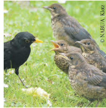
Der Nachwuchs vieler Gartenvögel wird gerade flügge.

Hecken schneidet, darauf achten, Vögel nicht unnötig zu stören. „Privatgärten und öffentliche Grünflächen sind wichtige Lebensräume im urbanen Raum, insbesondere, wenn sie naturnah gestaltet sind mit heimischen Hecken und Sträuchern. Diese Flächen tragen zur Artenvielfalt und zu einem angenehmen Stadtklima bei. Schon deshalb sollte der Erhalt solcher Grünflächen beim Klimaschutz mehr Gewicht erhalten“, ergänzt Malte Siegert, Vorsitzender des NABU Hamburg.