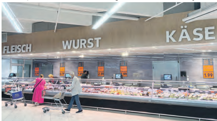
Der Fokus liegt klar auch auf den ansprechenden Bedienungstheken für Fleisch, Wurst, Käse, Fisch und Antipasti.

Stärkung regionaler Produzenten Kaufland nach eigenen Angaben ein wichtiges Anliegen ist, wird bei der Sortimentsauswahl ein besonderer Schwerpunkt auf Produkte von Lieferanten aus der Region gelegt. Neben bekannten Markenartikelherstellern gehören dazu auch zahlreiche Erzeugnisse mittelständischer Unternehmen. Die Kaufland-Filiale hat Montag bis Samstag von 7 bis 21.30 Uhr geöffnet. Das Center bietet seinen Kunden neben 1.000 kostenlosen Parkplätzen eine gute Anbindung an öffentliche Verkehrsmittel wie Bus und Bahn, so dass der Markt auch fußläufig gut zu erreichen ist.