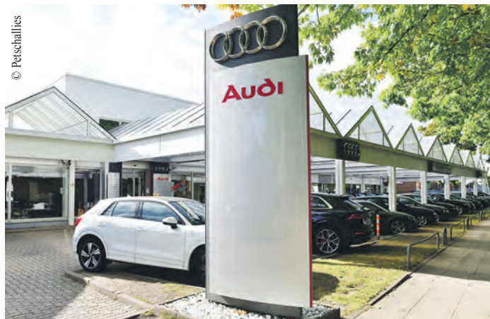
Hauptsitz des Unternehmens ist die Petschallies Sasel GmbH am Volksdorfer Weg 192.

Das Autohaus Petschallies gilt als traditionelles, bodenständiges und pflichtbewusstes Autohaus, welches die Kunden sehr zu schätzen wissen. Das Familienunternehmen ist seit 1973 für alle Volkswagen-, Audi-, Skoda- und Volkswagen Nutzfahrzeuge-Fahrer die Anlaufstelle in Ahrensburg, Volksdorf, Sasel, Poppenbüttel und in der Region. Gebrauchtwagen sind ebenso wie Neuwagen im Autohaus verfügbar. Mit top ausgebildeten, motivierten und qualifizierten Verkäufern wird für jedermann das passende Fahrzeug gefunden. Probefahrten der aktu-