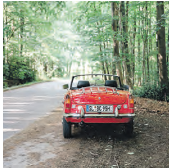
Beim Parken sollten Verdeck und Fenster immer geschlossen sein.

Es lohnt sich zu vergleichen, denn eine Vollkaskoversicherung leistet mehr und kann durchaus günstiger sein als eine Teilkasko. So greift sie im Gegensatz zur Teilkasko auch, wenn das Auto mutwillig beschädigt wird, beispielsweise wenn jemand das Verdeck aufschlitzt. „Unfallfreie Fahrer sichern sich in der Vollkaskoversicherung einen Schadenfreiheitsrabatt. Dadurch können sie im Laufe der Zeit deutlich weniger Beitrag zahlen.