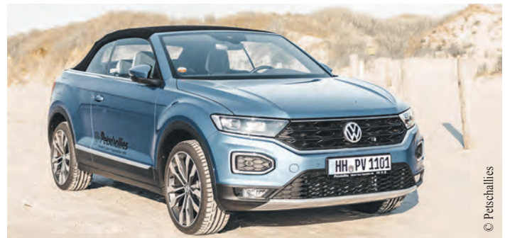
...auch das T-Roc Cabriolet von Volkswagen.

Farmsen da vielleicht gerade zur richtigen Zeit. Hier werden vom 11. bis zum 23. Juli das Audi A5 Cabriolet sowie das T-Roc Cabriolet von Volkswagen präsentiert. Die Fahrzeuge können während der Öffnungszeiten des Centers besichtigt werden. Also dann: ansehen, kaufen, losfahren! Denn sehen und gesehen werden – das funktioniert in einem traumhaft schönen Cabrio eben immer noch am besten. *Stand: März 2022