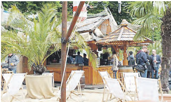
Bis zum 10. Juli dreht sich auf dem Wandsbeker Marktplatz alles um Sonne, Strand und Wasser.

Ein vielseitiges Veranstaltungsprogramm, zu dem unter anderem kostenlose Zumbakurse und ein