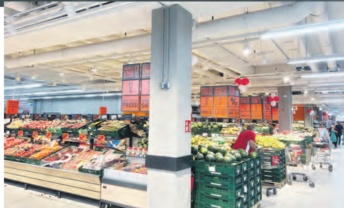
Ein riesiges Angebot gibt es in der Frische-Abteilung Obst und Gemüse im Eingangsbereich des Marktes.

Auf einer Verkaufsfläche von 5.600 Quadratmetern ergänzt der moderne Verbrauchermarkt das Angebot im Stadtteil. Damit wurden langfristig viele Arbeitsplätze geschaffen – auch für die bisherigen Real-Mitarbeiterinnen und -Mitarbeiter, die bei Kaufland eine neue berufliche Perspektive erhalten haben. Sie sorgen ab sofort dafür, dass die Kunden sich stets aus einem umfangreichen Sortiment an Lebensmitteln und vielfältigen Produkten für den