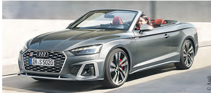
Zu sehen ist neben dem Audi A5 Cabriolet...

Der Sommer ist da und mit ihm auch Tage von schweißtreibender Sommerglut. Für diejenigen, die dann zumindest zeitweilig der Hitze entkommen wollen, gibt es zur Abkühlung folgende Empfehlung: Verdeck runter, Windschott hoch und Gas geben. Pessimisten sind Leute, die mit der Sonnenbrille in die Zukunft schauen, fand Heinz Erhard. Stimmt nicht. Sonst wären auch die Menschen Pessimisten, die sich ein Cabrio kaufen und in Städten wie Hamburg wohnen, wo es oft nur eine Handvoll warmer Oben-offen-Tage gibt. Die Hansestadt ist Deutschlands Cabrio-Hochburg – laut der CHECK24 Vergleichsportal für Kfz-Versicherungen GmbH sind 4,8 Prozent aller hier versicherten Pkw Modelle mit offenem Verdeck*. „Neben den sonnenver-