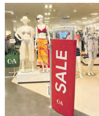
Attraktive Preisnachlässe gibt es beispielsweise bei C&A. geschaffen werden. Attraktive Preisnachlässe von bis zu 50 Prozent gibt es beispielsweise bei C&A, H&M und Deichmann.

T-Shirts, Kleider, Röcke, Tops und kurze Hosen, modische Sandalen oder Freizeitschuhe und Accessoires – wer auf der Suche nach einem trendigen Outfit für den Beachclub oder coolen Looks für Freibad, Ostsee oder Mittelmeer ist, sollte jetzt in den Einkaufstreffpunkt Farmsen kommen. Denn hier locken viele Modeanbieter zurzeit mit dem Mid Season Sale, einer Art Zwischenschlussverkauf, bei dem saisonale Kollektionen zu reduzierten Preisen angeboten werden. Mit dem Ausverkauf der aktuellen Ware soll genügend Platz für neue Kollektionen