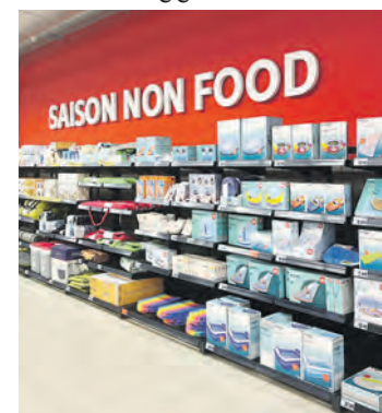
Saisonal wechselnde Aktionsware ergänzt das Angebot.

von 22 kW bis 300 kW an, kaufen ein und kehren im Anschluss zu ihrem geladenen Fahrzeug zurück. Und weil mit 100 Prozent Ökostrom geladen wird, wird der Besuch im EKT Farmsen noch nachhaltiger. Die Bezahlung erfolgt über alle gängigen Ladekarten und Apps sowie Ad-hoc-Laden per Kreditkarte.